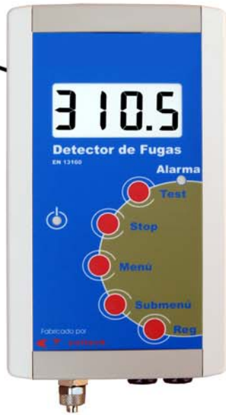
Vista Exterior Parte Frontal